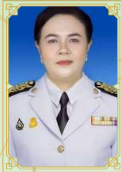
นางกชณีย์ ทิพนี นายกเทศมนตรีเมืองแม่โจ้