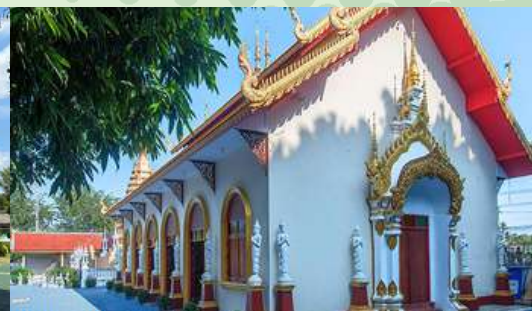
วัดสิริมงคล