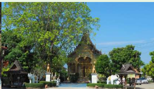
วัดห้วยเกียง