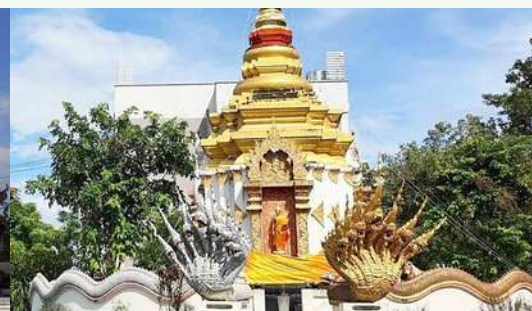
วัดมงคลนครฐี่