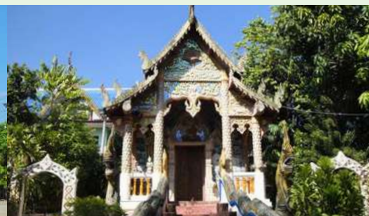
วัดศรีดอนชัยป่าตึงงาม (วัดแม่ヶถน้อย)