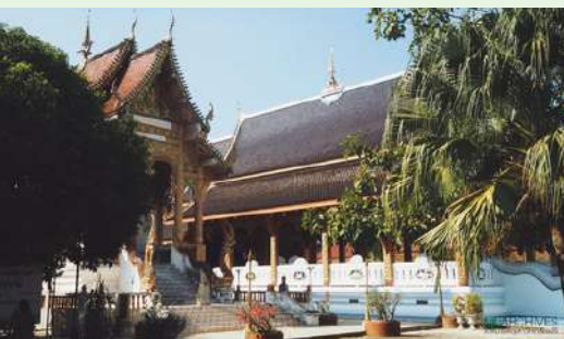
วัดป่าบง