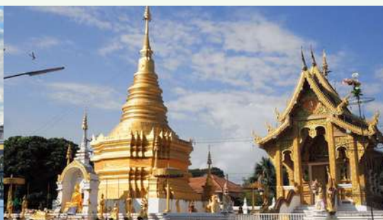
วัดแม่เตาไห