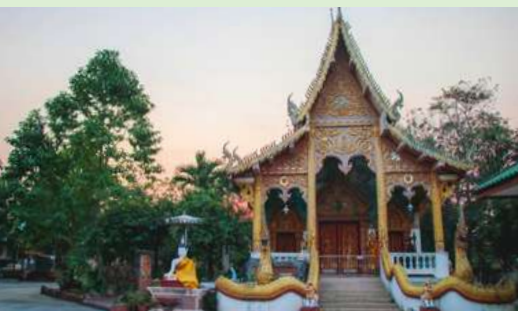
วัดทุ่งป่าเกิด