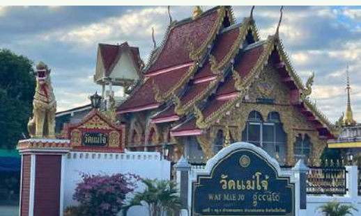
วัดแม่โจ้