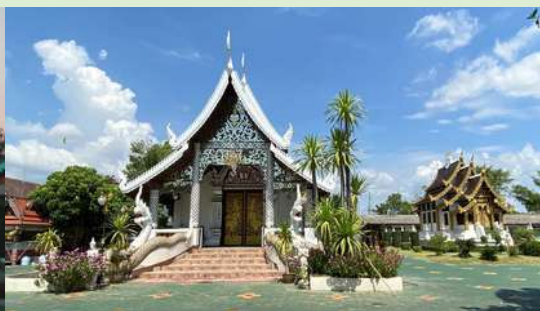
วัดทุ่งหมื่นน้อย